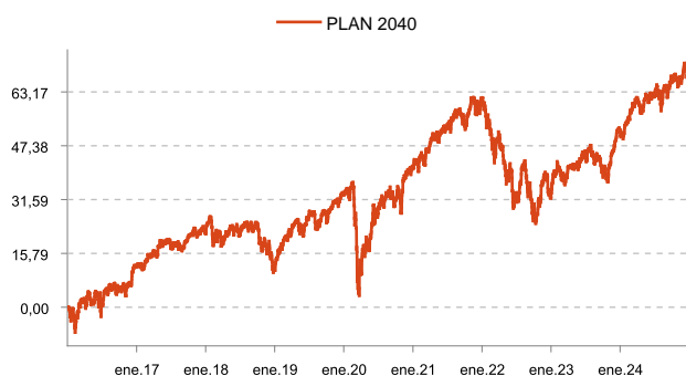
Rentabilidad PLAN 2040